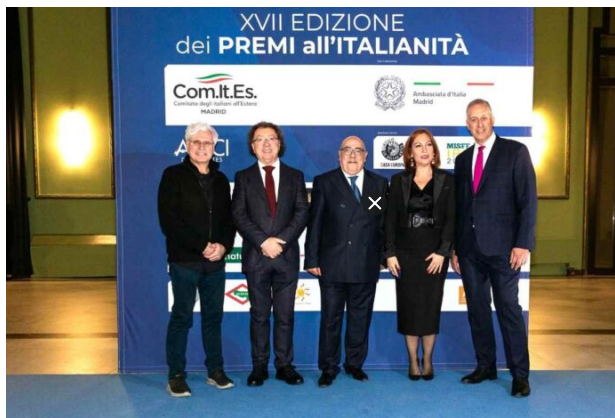
Un momento della cerimonia del Premio all'Italianità

Un evento che ha avuto anche finalità di promozione territoriale: il Presidente del MISFF Marcello Zeppi ha presentato le attività del festival cinematografico di Montecatini Terme – sia quelle realizzate nella città termale che quelle promosse in tutto il mondo con il tour Internazionale annuale – e, per l'occasione dei centocinquanta'anni dalla nascita di Galileo Chini -, è stata promossa dall'amministrazione comunale l'immagine di Montecatini Terme, come culla del Liberty e location culturale e turistica dall'appeal internazionale.