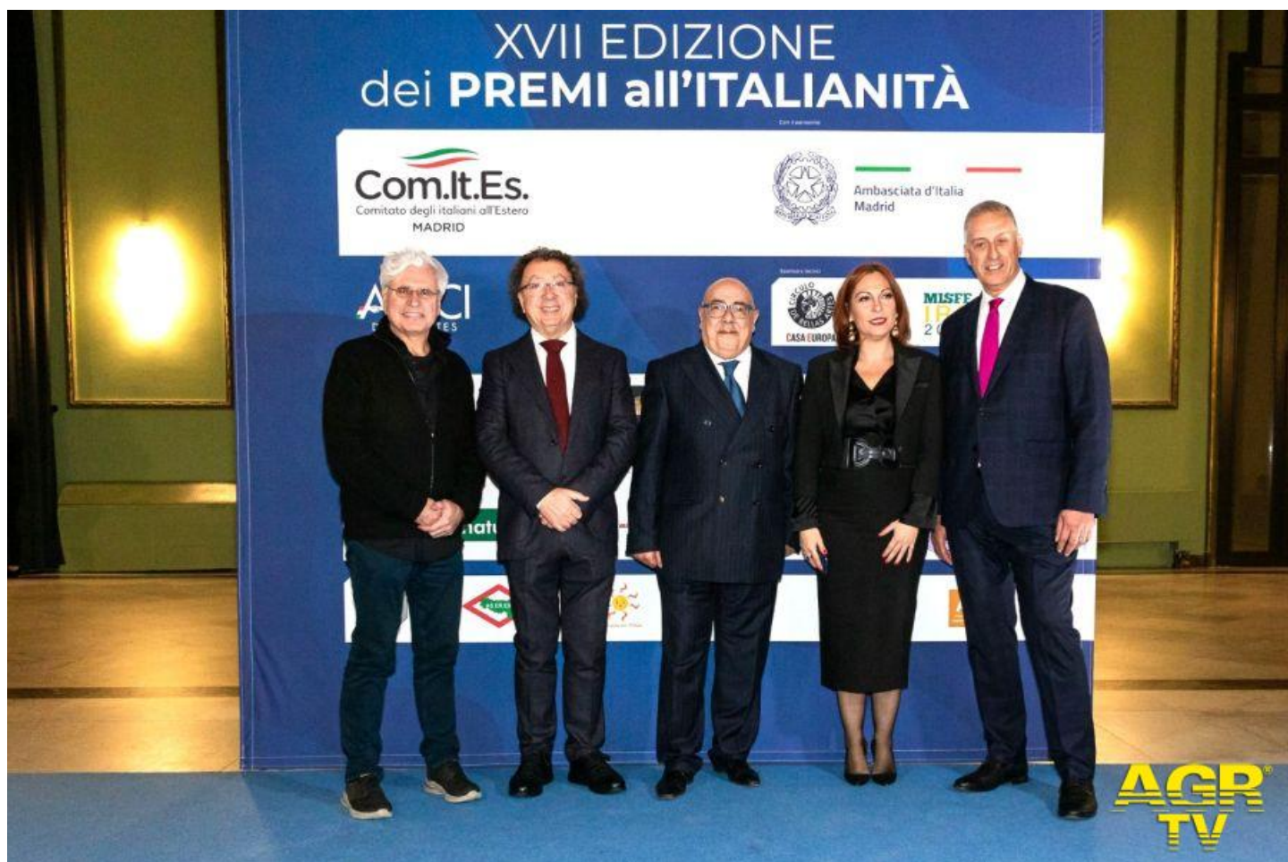
Montecatini International Short Film tappa spagnola

(AGR) MONTECATINI, 7 DICEMBRE 2023. Tappa spagnola per il roadshow internazionale del MISFF - Montecatini International Short Film Festival: il festival diretto da Marcello Zeppi è stato protagonista, lunedì 4 e martedì 5 dicembre, del doppio evento promosso dal Comitato degli italiani all'Estero (Com.It.Es) presso il Circolo de Bellas Artes e la Scuola Statale Italiana di Madrid.